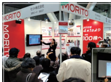
▲ブース内での説明会

2013年2月15日～16日の二日間「東証IRフェスタ2013」(於:東京国際フォーラム)、2013年3月3日「ツバルの森IRフォーラム2013」(於:グランキューブ大阪)が開催され、当社も出展いたしました。ブース内にて会社説明会などを行い、個人投資家のみなさまが説明会へご参加くださいました。その他にも月に2回程度、東京、名古屋、大阪などで個人投資家向け会社説明会に参加しています。 今後の予定しているIR活動は、8月30日～31日の二日間 東京ビックサイト(江東区有明)にて行われます「日経IRフェア2013」へ出展を予定しております。お近くへお越しの際はぜひ、お立ち寄りください。 今後も引き続きIR活動に力をいれてまいります。