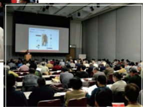
▲個人投資家のみなさまが熱心に傾聴してくださいました