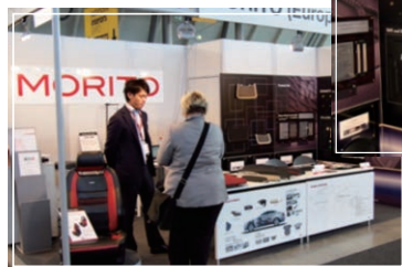
▲モリトブースの様子

2013年6月4日～6日の三日間 ドイツ シュトゥットガルトにて「Automotive Interiors Expo 2013」が開催され、モリトヨーロッパが出展いたしました。同展示会は車両内装部品・成型品の展示会で、モリトブースでは、フロアマット用のエンブレムやネットを中心にご紹介いたしました。主なターゲットとしていた欧州自動車メーカーだけでなく、韓国自動車メーカーの訪問もあり、多数のお客様がモリトブースに来場いただきました。今後もグローバル成長企業を目指し、世界各国のお客様との接点を大切にまいります。