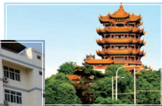
▲武漢にある名楼「黄鶴楼」