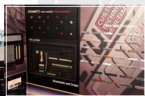
▲展示の商品サンプル (エンブレムやネット)